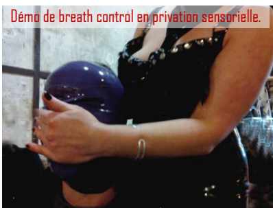
Démo de breath control en privation sensorielle.

Tout au long de l'atelier, ce sont ensuite des exercices de mise en pratique qui se succèdent. Comment installer un jeu de "breath control", contrôle de la respiration, sans provoquer de désagrément (syncope, gêne respiratoire trop importante, etc.), où appuyer sans blessier , quel accessoires utiliser, etc.