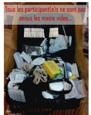
Tous les participant(e)s ne sont pas venus les mains vides...

Un immense merci aux dizaines de participant(e)s aux ateliers PariS-M qui nous ont fait confiance depuis toutes ces années, vos sourires sont toujours notre plus belle récompense .