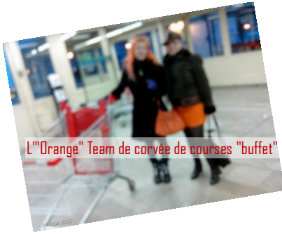
L'"Orange" Team de corvée de courses "buffet"

L'atelier de notre ami photographe à quelques encablures à peine du périphérique. L'aventure certes, mais à 5 minutes du métro. Le staff s'affaire, qui à la préparation du somptueux buffet qui à l'accueil des premiers invités.